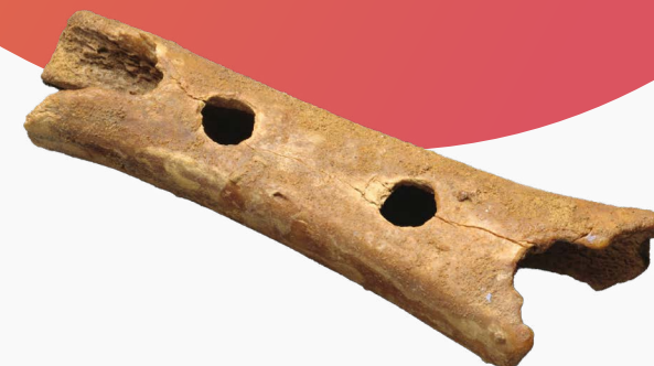
Neandertalčeva piščal