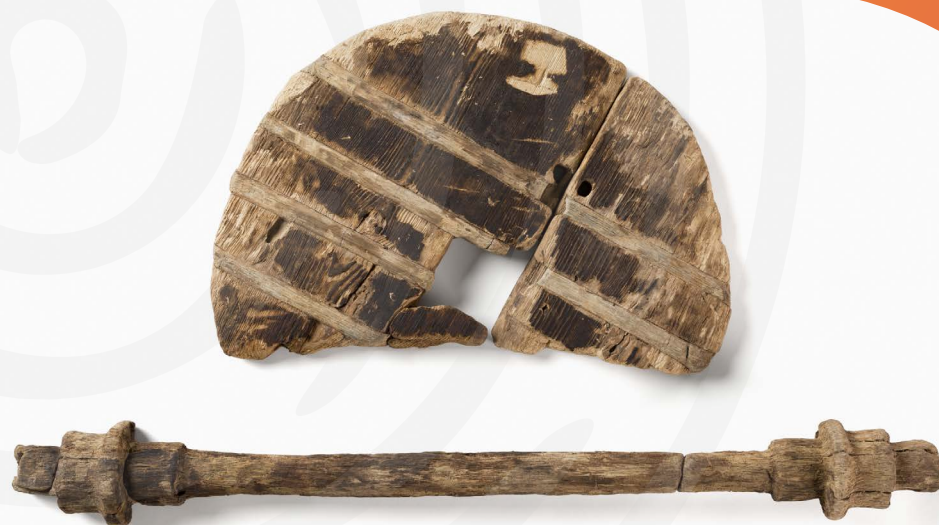
Najstarejše leseno kolo z osjo

Od Potočke zijalke, visokogorske postojanke paleolitskih lovcev, do neandertalčeve piščali iz Divjih bab, najstarejšega glasbila na svetu, in najstarejšega, 5200 let starega lesenega kolesa z osjo na svetu, ki je pokukalo na plan iz močvirnatga Ljubljanskega barja – arheološka najdišča v Sloveniji so zelo bogata z najdbami, kar priča o zelo živahnem dogajanju v minulih tisočletjih na tem področju in pomembni geostrateški legi. Mnoge dragocene najdbe bogatijo tudi zbirke zgodovinskih mest in pripovedujejo zanimive zgodbe o življenju in navadah naših prednikov, o boju za obstanek in prevlado, pa tudi zgodbe o napredku in razcvetu. Naj spregovorijo sledi preteklosti.